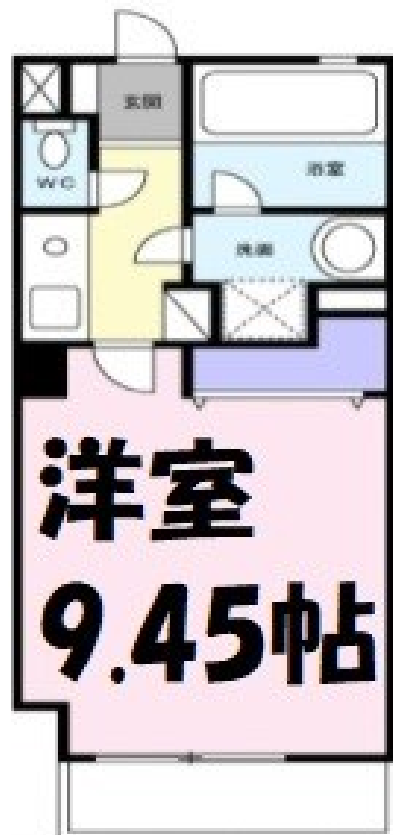
図面と現況が異なる場合は、現況優先とします。