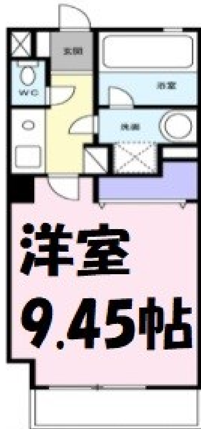
図面と現況が異なる場合は、現況優先とします。