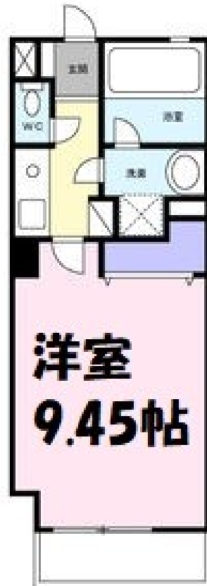
※図面と現況が異なる場合は、現況優先とします