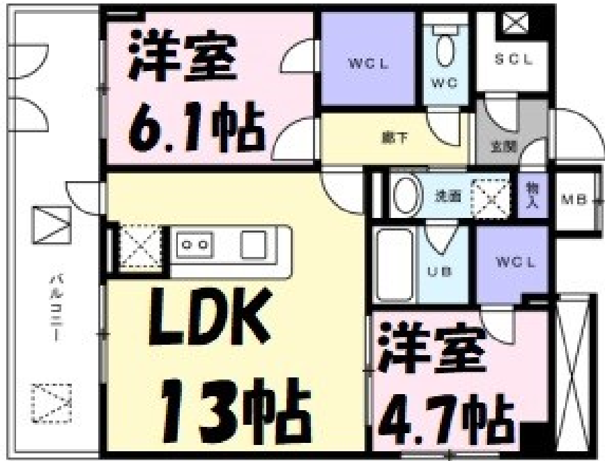
※図面と現況が異なる場合は、現況優先とします