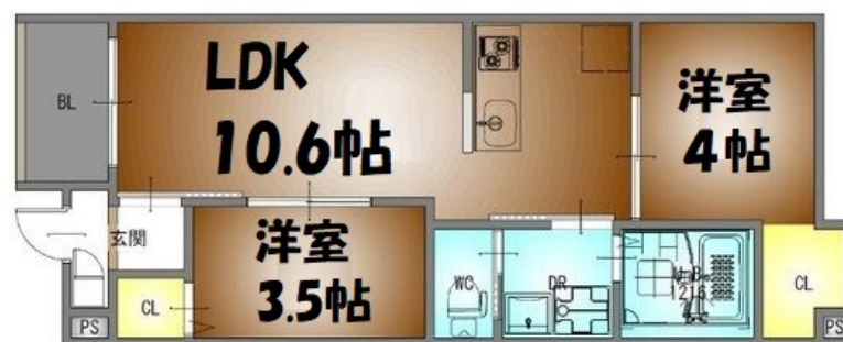
2号室 平面図 S:1/50