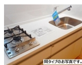
※同タイプのお写真です。